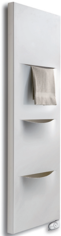
design by Alessandro Caneppa

Interasse dal centro foro al muro 40 mm. Distance between hole center and wall 40 mm. Distance du centre du trou au mur 40 mm. Abstand zwischen Lochmitte und Wand 40 mm. Distancia entre el centro del agujero y el muro 40 mm. Расстояние между центром отверстия и стеной – 40 мм.