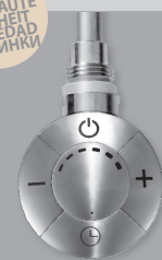
H1CR / H2CR

NOVITÀ NEW NOUVEAUTÉ NEUHEIT NOVEDAD НОВИНКИ