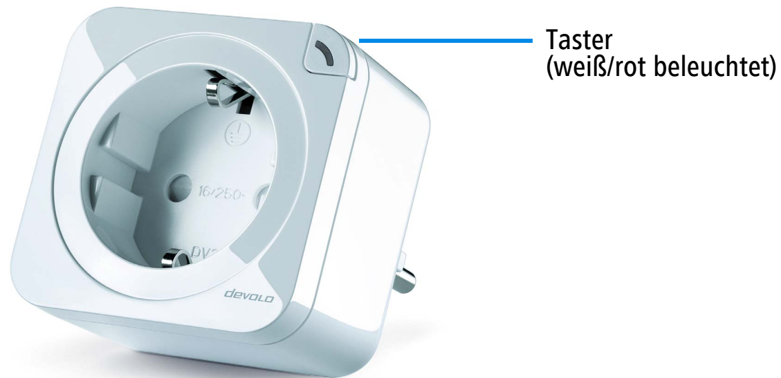
Abbildung ist länderspezifisch

Die Home Control Schalt- und Messsteckdose ist eine schaltbare Funksteckdose der Schutzklasse 1. Das Gerät dient dem manuellen und/oder automatisierten An- und Ausschalten von angeschlossenen Geräten mit einer Last von bis zu 13A, was etwa einer Leistung von 3 kW bei einer Netzspannung von 230V entspricht. Die Home Control Schalt- und Messsteckdose zeichnet sich durch ihr integriertes Z-Wave-Modul aus. So kann das Produkt kabellos an die Steuereinheit angemeldet werden und mit anderen Z-Wave-Geräten kommunizieren. Die Home Control Schalt- und Messsteckdose lässt sich über das Home Control-Portal schalten. Eine Besonderheit ist auch die integrierte Stromverbrauchsmessung, die angeschlossene Geräte überwacht und protokolliert.